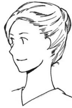
図4 女性 (頭髪の例)