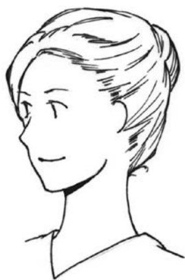
図3 女性 (頭髪の例)

女性は、原則としてスーツのインナートップスに相当するもの (襟付きのブラウス等、淡色系)、黒、白または地味な色のフルレングスのズボンを着用する。